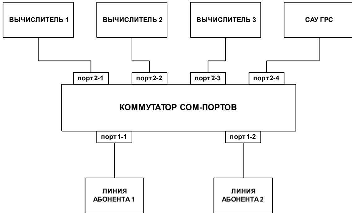
Рисунок 1 – Структурна схема комутатора СОМ-портів

Комутатор СОМ-портів призначено для підключення двох абонентів із різними пріоритетами до групи обчислювачів типу СУПЕРФЛОУ, ФЛОУТЕК, ФЛОІНЕК, ДАНИФЛОУ та інших комплексів газорозподільних станцій згідно з рисунком 1.